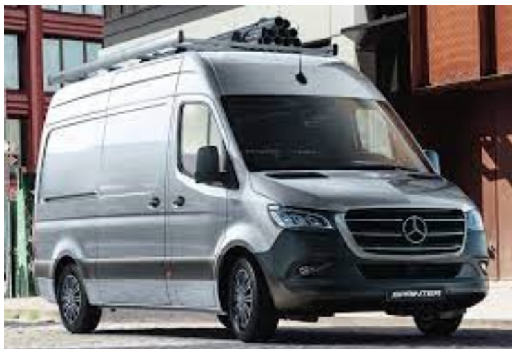
Slika 12. Mercedes-Benz eSprinter

Za predstavnika kategorije kombija uzet ćemo Mercedes-Benz eSprinter kao što je prikazano na slici 12 [17].