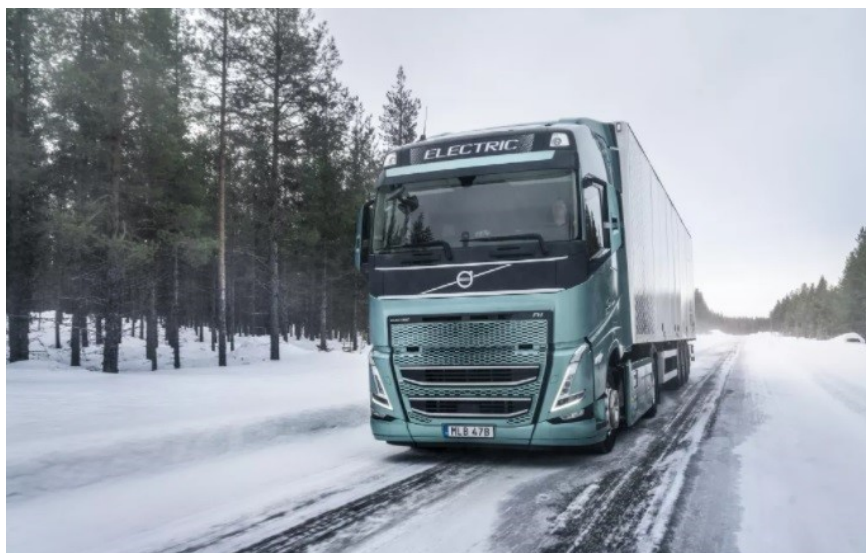
Slika 14. Volvo FL Electric

Za predstavnika kategorije kamiona uzet ćemo Volvo FL Electric kao što je prikazano na slici 14 [19].