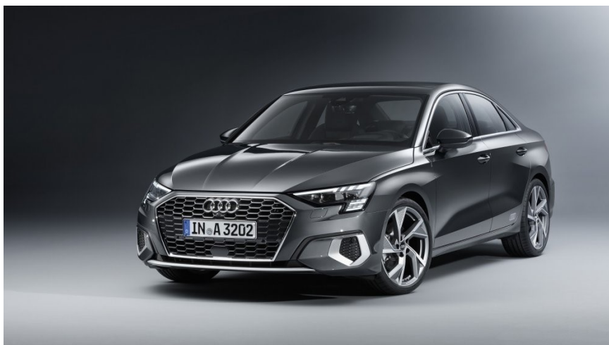
Slika 2. Audi A3

Za svaku kategoriju voznog parka, koje smo već ranije u radu naveli da ćemo razmatrati, prikazat ćemo predstavnika za kojeg ćemo provesti proračun. Podatci koji su vezani za svaku kategoriju općenito, bit će kasnije detaljnije objašnjeni. Za sedam kategorija imamo ukupno sedam predstavnika za konvencionalni pogon te sedam predstavnika za električni pogon. Svaki predstavnik uzet je kao nekakva sredina svoje kategorije po svim aspektima. Za početak ćemo prikazati predstavnike svake kategorije vozila za slučaj konvencionalnog pogona.