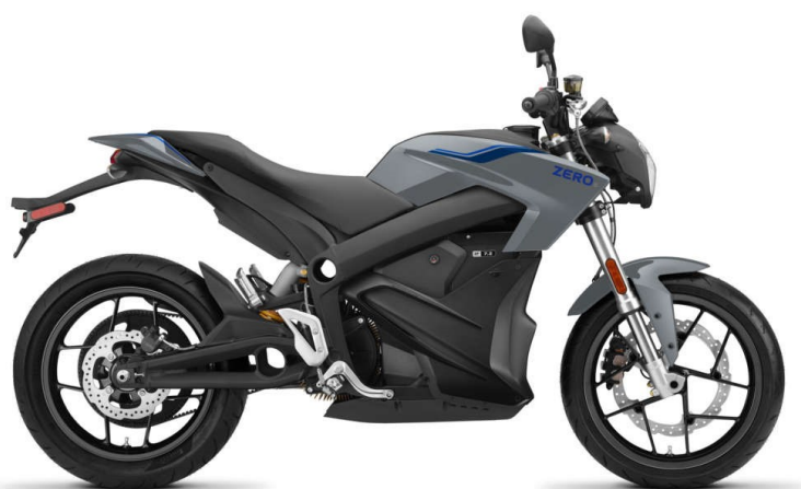
Slika 15. Zero S

Za predstavnika kategorije kamiona uzet ćemo Volvo FL Electric kao što je prikazano na slici 14 [19].