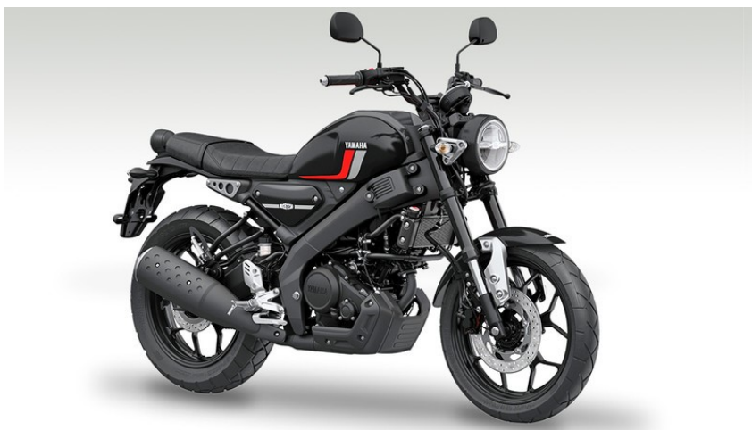
Slika 8. Yamaha XSR 125

Za predstavnika kategorije motocikala uzet ćemo Yamahu XSR 125 kao što je prikazano na slici 8 [13].