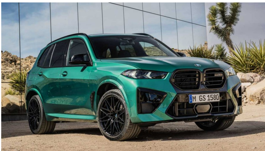
Slika 4. BMW X5 M50d

Za predstavnika kategorije sportskih vozila uzet ćemo Porsche 911 GT3 kao što je prikazano na slici 3 [8].