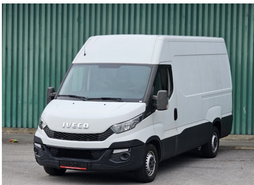
Slika 5. Iveco daily

Za predstavnika kategorije SUV vozila uzet ćemo BMW X5 M50d kao što je prikazano na slici 4 [9].