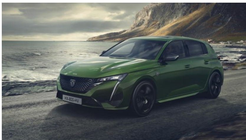
Slika 9. Peugeot e308

Za slučaj električnog pogona vozila također imamo sedam predstavnika koji će biti prikazani u daljnjem tekstu, svaki za svoju kategoriju koju predstavlja.