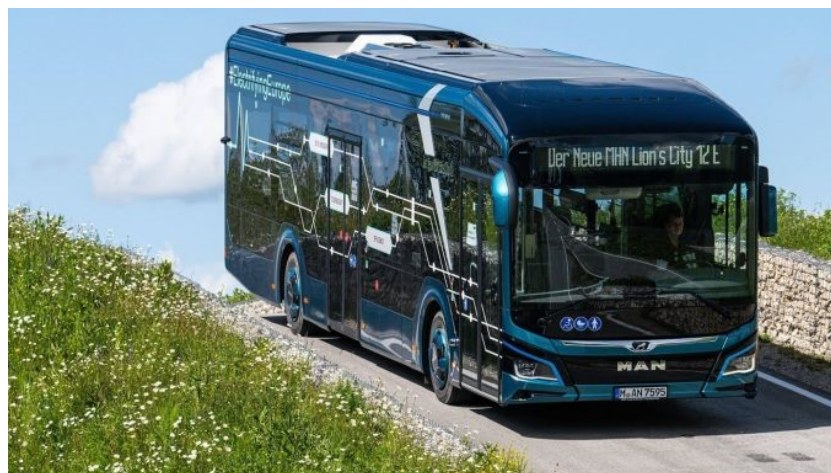
Slika 13. MAN Lion's City E

Za predstavnika kategorije kombija uzet ćemo Mercedes-Benz eSprinter kao što je prikazano na slici 12 [17].