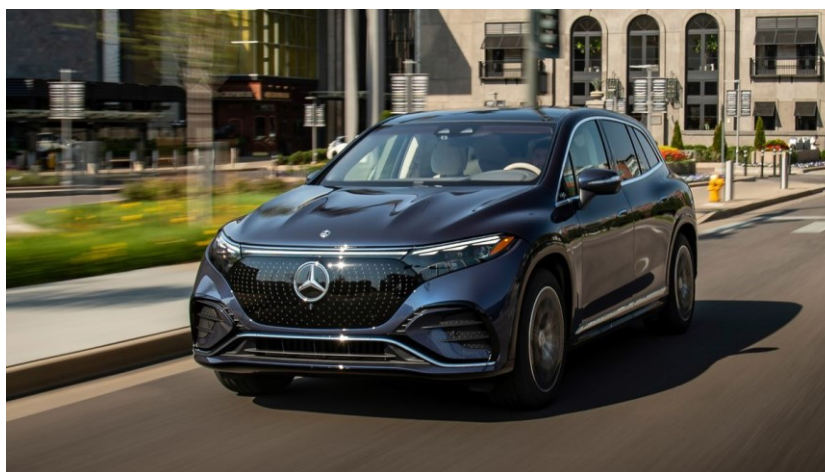
Slika 11. Mercedes-Benz EQS

Za predstavnika kategorije sportskih vozila uzet ćemo Porsche Taycan Turbo S kao što je prikazano na slici 10 [15].