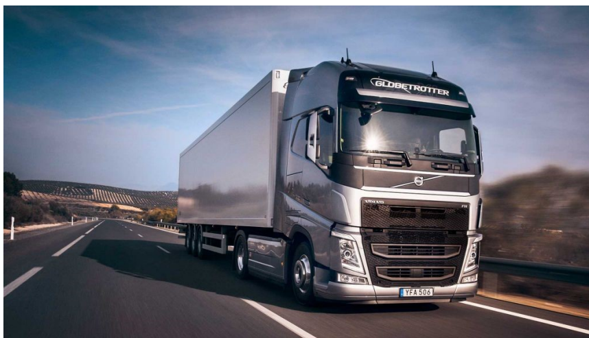
Slika 7. Kamion marke Volvo

Za predstavnika kategorije autobusa uzet ćemo autobus marke Mercedes - Benz kao što je prikazano na slici 6 [11].