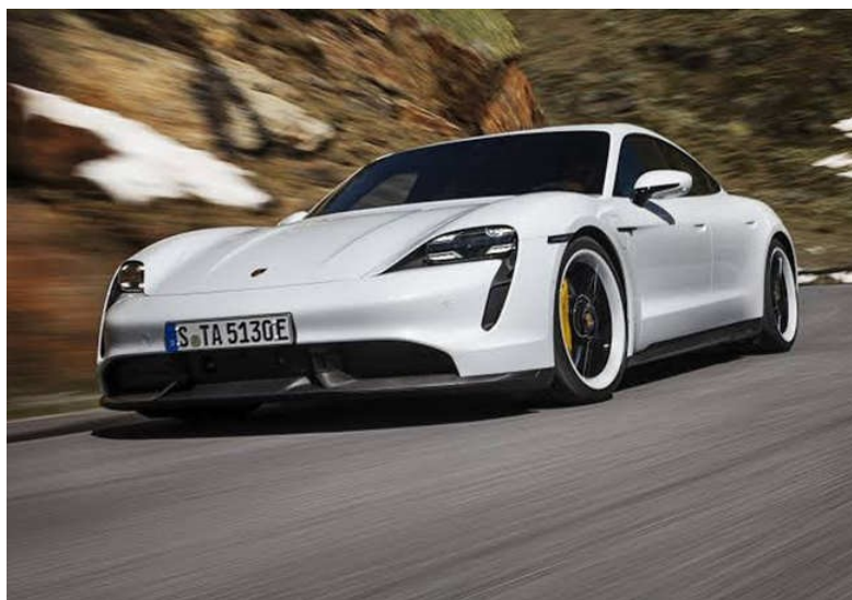
Slika 10. Porsche Taycan Turbo S

Za predstavnika kategorije sportskih vozila uzet ćemo Porsche Taycan Turbo S kao što je prikazano na slici 10 [15].