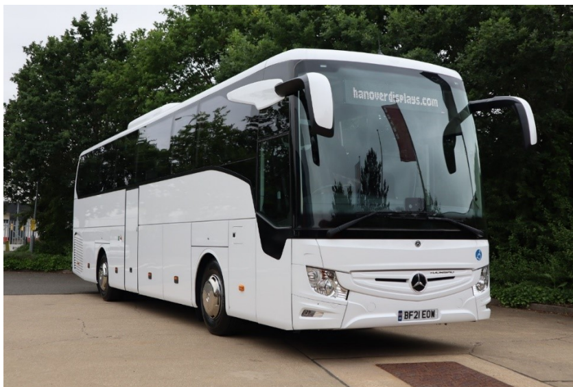
Slika 6. Autobus marke Mercedes-Benz

Za predstavnika kategorije autobusa uzet ćemo autobus marke Mercedes - Benz kao što je prikazano na slici 6 [11].