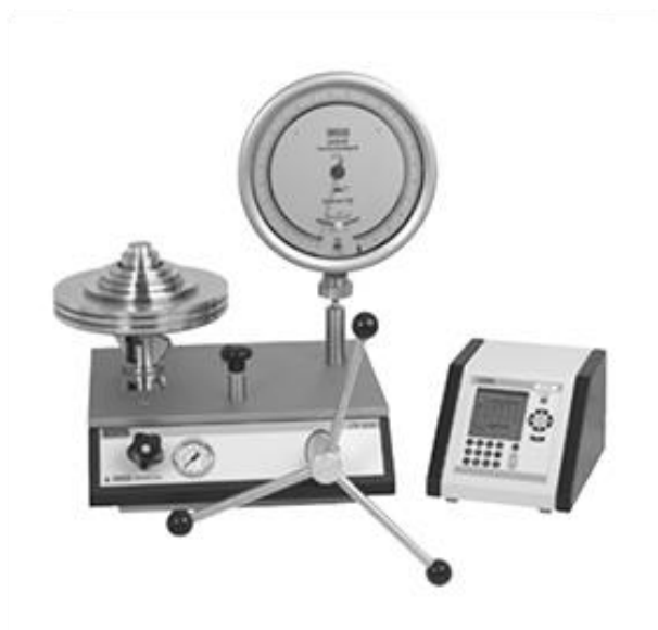
Slika 1. Tlačna vaga

Mjerna sljedivost je svojstvo mjernog rezultata ili vrijednosti etalona po kojemu se on može dovesti u vezu s navedenim referencijskim etalonima (obično državnim ili međunarodnim) neprekinutim lancem usporedbi koje imaju utvrđene nesigurnosti.