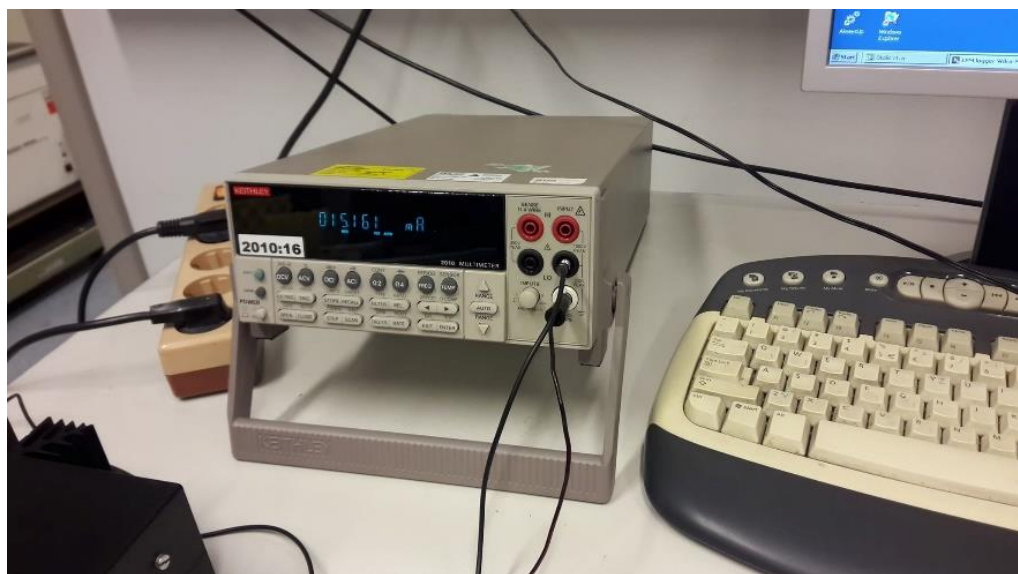
Slika 4. Prikaz umjeravanja na plinu