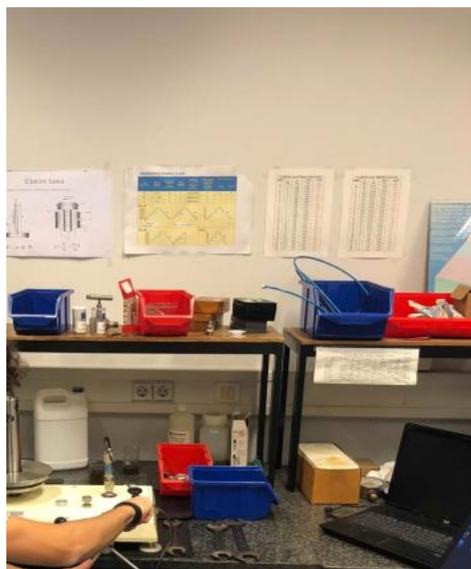
Slika 5. Prikaz umjeravanja na ulju