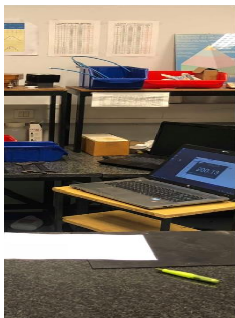
Slika 6. Prikaz umjeravanja na ulju