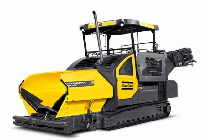
Slika 7.5 Stroj za asfaltiranje cestovne infrastrukture.