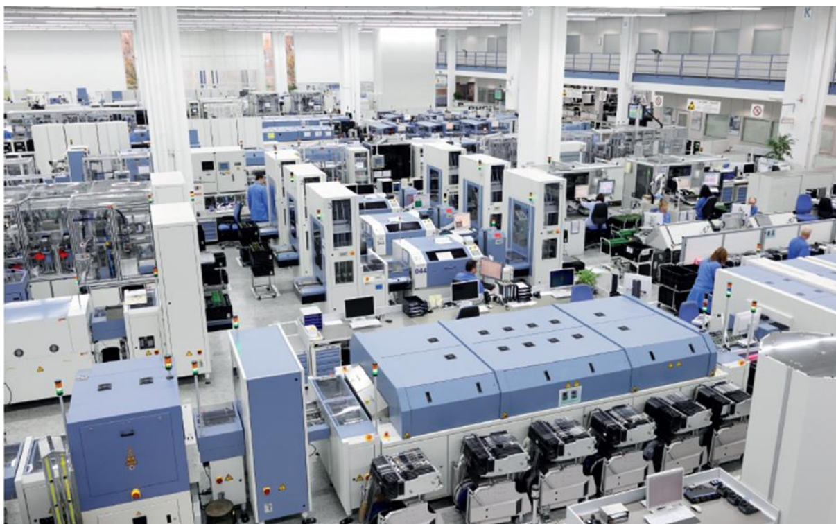
Slika 18. Prikaz Siemensove digitalne tvornice u Ambergu.