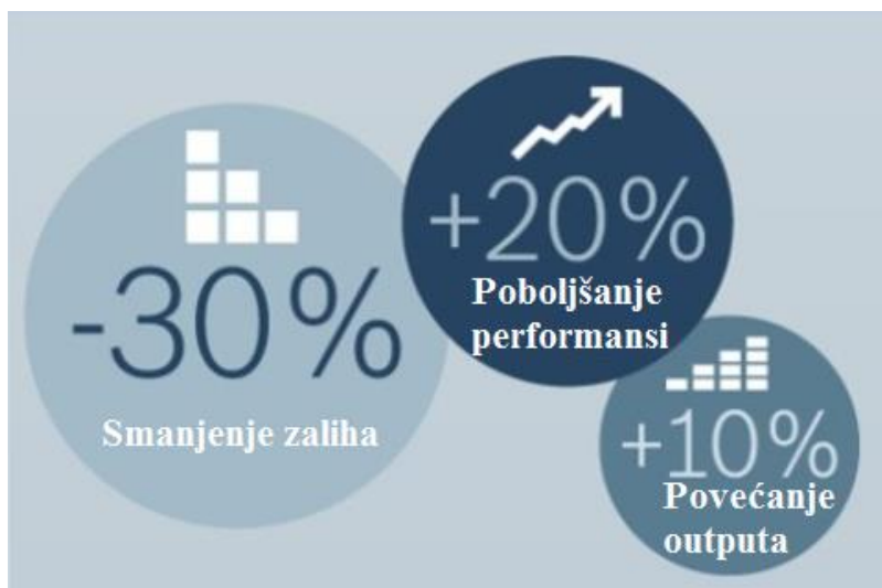
Slika 17. Koristi primjene Industrije 4.0 u Bosch Rexroth tvornici u Hamburgu.

Na slici 17. se mogu vidjeti koristi primjene Industrije 4.0 u tvornici Bosch Rexroth u Hamburgu. Bez ikakvih dodatnih modifikacijama na strojevima tvornica je u stanju proizvoditi više od 200 različitih hidrauličkih ventila na jednoj proizvodnoj liniji. Rezultat toga je: fleksibilna i ekonomski isplativa proizvodnja koja donosi 10 % više outputa i smanjenje zaliha za 30 %.