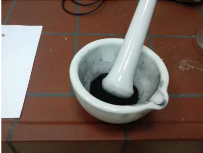
Slika 3.2. Tarionik sa usitnjenim ugljenom

Za razliku od ugljena u dostavnom stanju, ugljen u sušenom stanju je bio stavljen u želatinoznu kapsulu. Zbog toga se u jednadžbi za računanje ogrjevne vrijednosti mora uzeti u obzir i ogrjevna vrijednost kapsule: