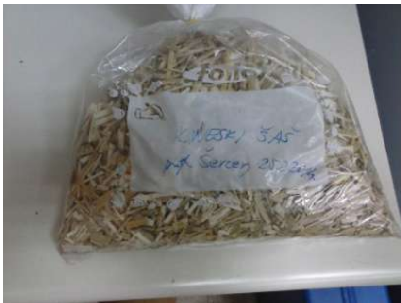
Slika 3.3. Kineski šaš

Drugo gorivo koje se ispitivalo su bili peleti od kineskog šaša. Peleti se dobivaju od različitih biljnih vrsta, drvenaste građe. Nakon što se osušena biljka usitni, potrebno je zagrijavati usitnjeni materijal, da bih došlo do izlučivanja prirodnog vezivnog sredstva iz same biljke. Različite biljke imaju različite temperature pri kojima puštaju ta vezivna sredstva. Pri zagrijavanju se ujedno i materijal provodi kroz ekstruder, koji provlači materijal kroz uski, kružni, poprečni presjek iz kojeg izlazi oblikovan pelet. Peleti su najčešće promjera 5-10 mm i dužine 10-40mm. Odlično su ogrjevno sredstvo, zbog svoje čvrstoće i jednostavnog doziranja u ložište. Udio vlage je vrlo nizak, te se kreće do maksimalno 10%. Zbog dobrih svojstava kao gorivo, kompaktnost i prirodni materijal, sve više se koristi.