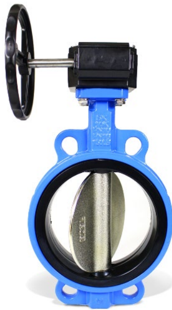
Slika 12. Leptirasti ventil [12]

Leptirasti ventili su ventili koji se isto većinom koriste, kao i kuglasti ventili, za potpuno uključivanje i isključivanje. Prednost ove vrste ventila je što koriste malo prostora te imaju malu težinu, nisku cijenu i dostupni su u mnogim veličinama. Ovi ventili imaju disk koji je koncentričan sa cijevima, povezan je kroz svoje središte sa šipkom, okretanjem šipke oko svoje osi pa tako i diska otvara se i zatvara ventil. Ventil je u potpunosti zatvoren kada je disk okomit na protok fluida, a u potpunosti je otvoren kada se iz te pozicije rotira za 90^\circ i disk bude paralelan sa protokom fluida. Ovisno o konstrukciji ventila mogu se javiti dvije moguće karakteristike protoka, linearni i istopostotni.