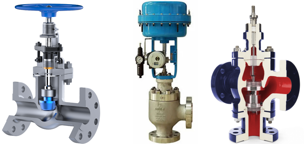
Slika 7. a) Sferni ventil, b) Kutni sferni ventil, c) Trosmjerni sferni ventil [6], [7], [8]

Kutni sferni ventili rade na isti princip kao i obični sferni osim što također omogućuju spajanje cijevi pod kutom od 90^\circ . Trosmjerni sferni ventili također rade na isti princip, jedina razlika je što omogućuju dijeljenje ulaznog protoka na 2 izlaza.