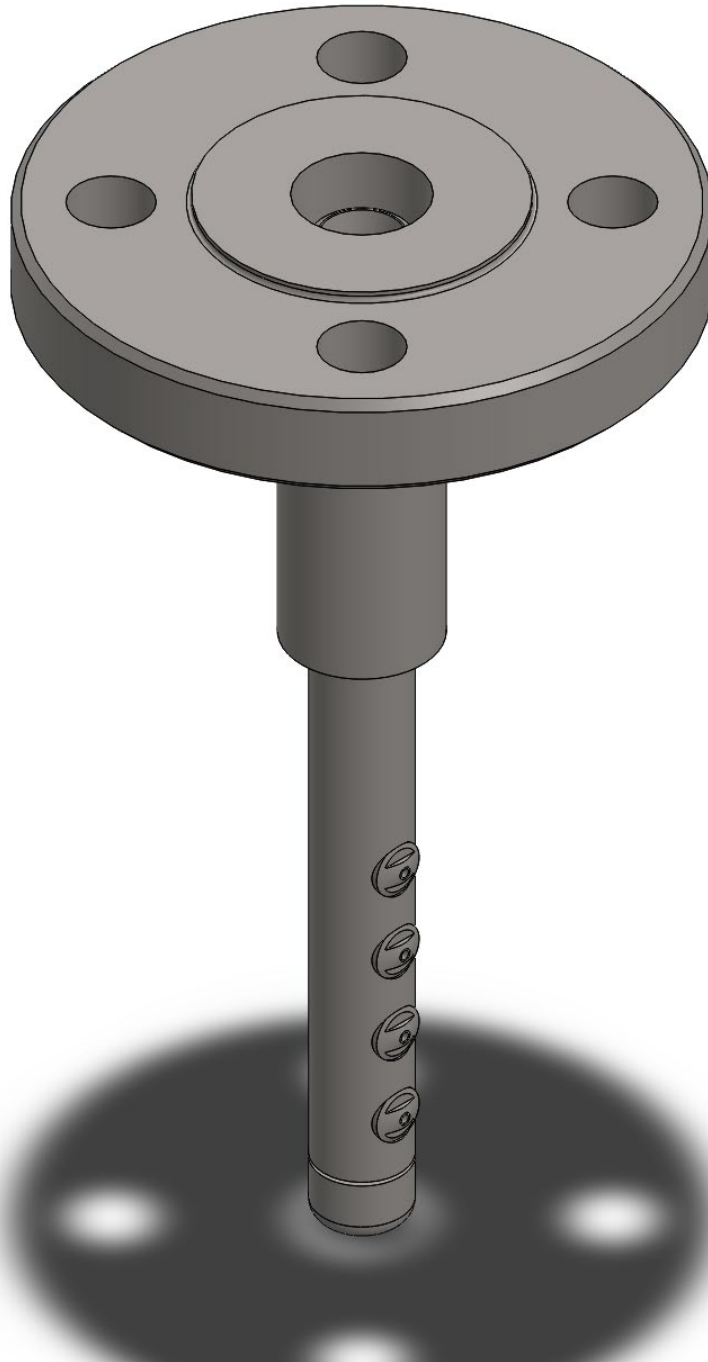
Slika 16. Prikaz rashladnog sustava