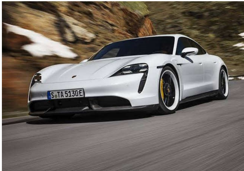
Slika 10. Porsche Taycan Turbo S

Za predstavnika kategorije sportskih vozila uzet ćemo Porsche Taycan Turbo S kao što je prikazano na slici 10 [15].