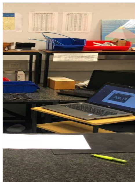
Slika 6. Prikaz umjeravanja na ulju