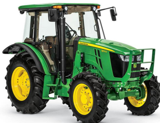
Slika 7.7 Poljoprivredni traktor.

Poljoprivredni traktori su pogonjeni motorima s unutarnjim izgaranjem s kompresijskim paljenjem čija snaga se kreće o 20 kW do 250 kW. Traktori služe i za poljoprivredne i za šumarske radove. Prema [4].