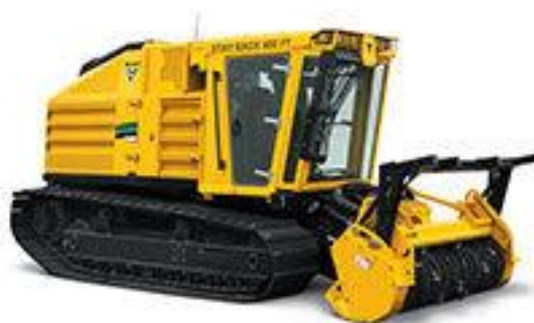
Slika 7.9 Poljoprivredna kosilica.

Koriste se u poljoprivredi i šumarstvu kao stroj za šišanje trave, raslinja i šikara. Mogu biti pogonjene s motorima s unutarnjima izgaranjem s vanjskim izvorom paljenja i kompresijskim paljenjem. Raspon snage je od 50 kW do 250 kW. Prema [4].