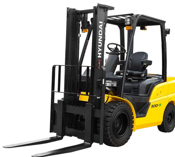
Slika 7.6 Viličar marke Hyundai.

Ako se radi o viličaru koji se koristi za rad u zatvorenom prostoru onda su pogonjeni elektromotorom. Osim elektromotorom, mogu biti pokretani i motorima s unutarnjim izgaranjem, s vanjskim izvorom paljenja i s kompresijskim paljenjem. Snage im se kreću od 20 kW do 100 kW. Prema [4].