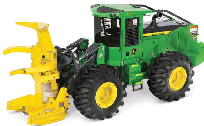
Slika 7.10 Šumarski traktor tvrtke John Deere.

Najčešće su pogonjeni s motorima s kompresorskim paljenjem raspona snage od 25 kW do 75 kW. Upotreba je za radove i prijevoz u šumi. Prema [4].