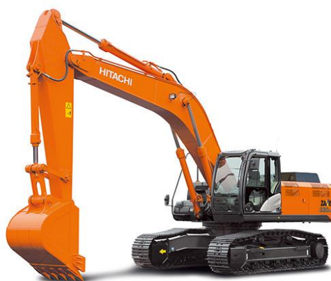
Slika 7.2 Rovokopač proizvođača Hitachi.

Glavna upotreba je iskopavanje i premještanje zemlje. Razlikuju se po veličini i snazi motora s unutarnjim izgaranjem koji se ugrađuje u njih. Postoji više kategorija rovokopača.