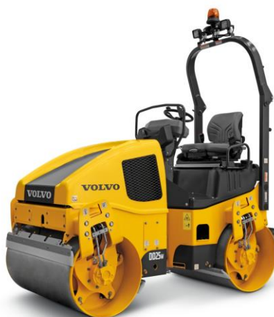
Slika 7.1 Građevinski valjak.

Koriste se za završne radove prilikom gradnje prometnica, njihova svrha je sabijanje i ravnjanje podloge. Najčešći pogon viličara je motor s unutarnjim izgaranjem kompresijskim paljenjem snage do 380kW. U novijim izvedbama i manjim modelima snage motora se kreću do 55 kW. Prema [4].