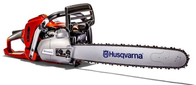
Slika 7.8 Profesionalna motorna pila tvrtke Husqvarna.

Pogon koji se koristi za profesionalne motorne pile je dvotaktni motor s unutarnjim izgaranjem s vanjskim izvorom paljenja. Raspon snage im se kreće od 2 kW do 6 kW. Prema [4].