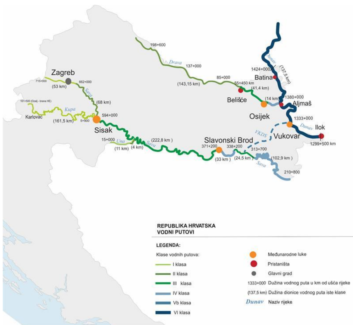
Slika 10.1 Karta unutarnje plovidbe brodova Republike Hrvatske

Unutar diplomskog rada prikupljeni su podatci o brodovima za unutarnju plovidbu u Republici Hrvatskoj. Unutarnja plovidba brodova u RH najvećim dijelom odvija se na području slavonsije. Brodovi plove po rijekama Dunav, Sava, Drava, Una i Kupa. U četiri grada postoji Lučka Uprava. Gradovi u kojima postoji Lučka Uprava su: Vukovar, Osijek, Slavonski Brod i Sisak. Na slici 10.1 je prikazana karta unutarnje plovidbe brodova Republike Hrvatske. Prema [21]