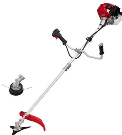
Slika 7.12 Trimer korišten u domaćinstvu.

Uglavnom pogonjeni dvotaktnim motorima s vanjskim izvorom paljenja, a snage im se kreću od 0,25 kW do 1,4 kW. Prema [4].