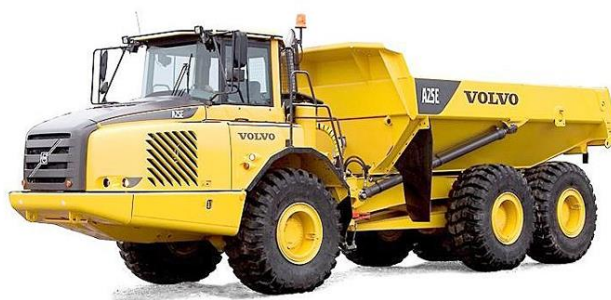
Slika 7.3 Kiper tvrtke Volvo.

Postoje kiperi raznih veličina, manji kiperi se koriste na gradilištima, najčešće za pogon koriste motor s unutarnjim izgaranje koji zapaljenje vrši kompresijskim putem. Snaga motora se kreće od 50 kW do 500 kW. Prema [4].