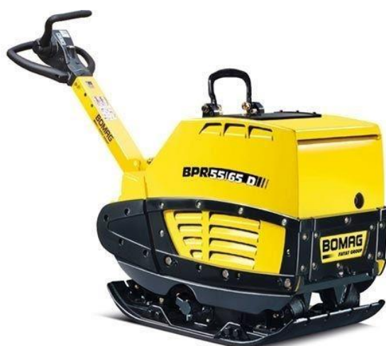
Slika 7.4 Stroj za sabijanje podloge.

Strojevi za sabijanje podloge najčešće su pogonjeni dvotaktnim motorima s vanjskim paljenjem, čija je snaga od 1 kW pa sve do 3 kW. Razlikujemo još i strojeve za sabijanje podloge pogonjene četverotaktnim motorima s vanjskim izvorom paljenja ili kompresorskim paljenjem. Snaga im se kreće od 2 kW do 21 kW. Prema [4].