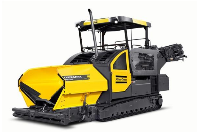
Slika 7.5 Stroj za asfaltiranje cestovne infrastrukture.