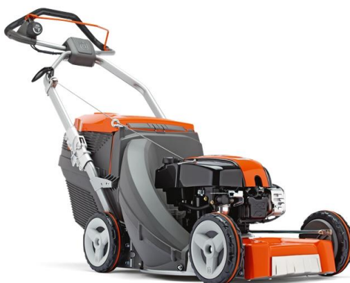
Slika 7.11 Kosilica za domaćinstvo.

Najčešći pogon korištena u kosilicama u domaćinstvu su dvotaktni i četverotaktni motori s vanjskim izvorom paljenja. Snage motora kreću se od 1 kW do 10 kW. Zapremnina motora se kreće od 100 kubičnih centimetara do 250 kubičnih centimetara. Prema [4].