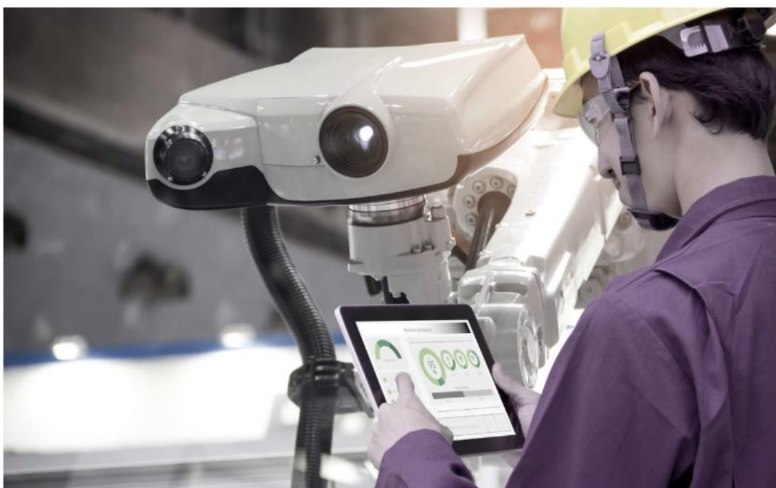
Slika 10. Visokorezolucijske kamere koje prikupljaju vizualne podatke za obradu u kontroli kvalitete [14].

Ti prikupljeni vizualni podaci se analiziraju pomoću AI sustava koji mogu predvidjeti moguće kvarove, omogućujući prediktivno održavanje i smanjujući neplanirane zastoje koji mogu negativno utjecati na proizvodnju.