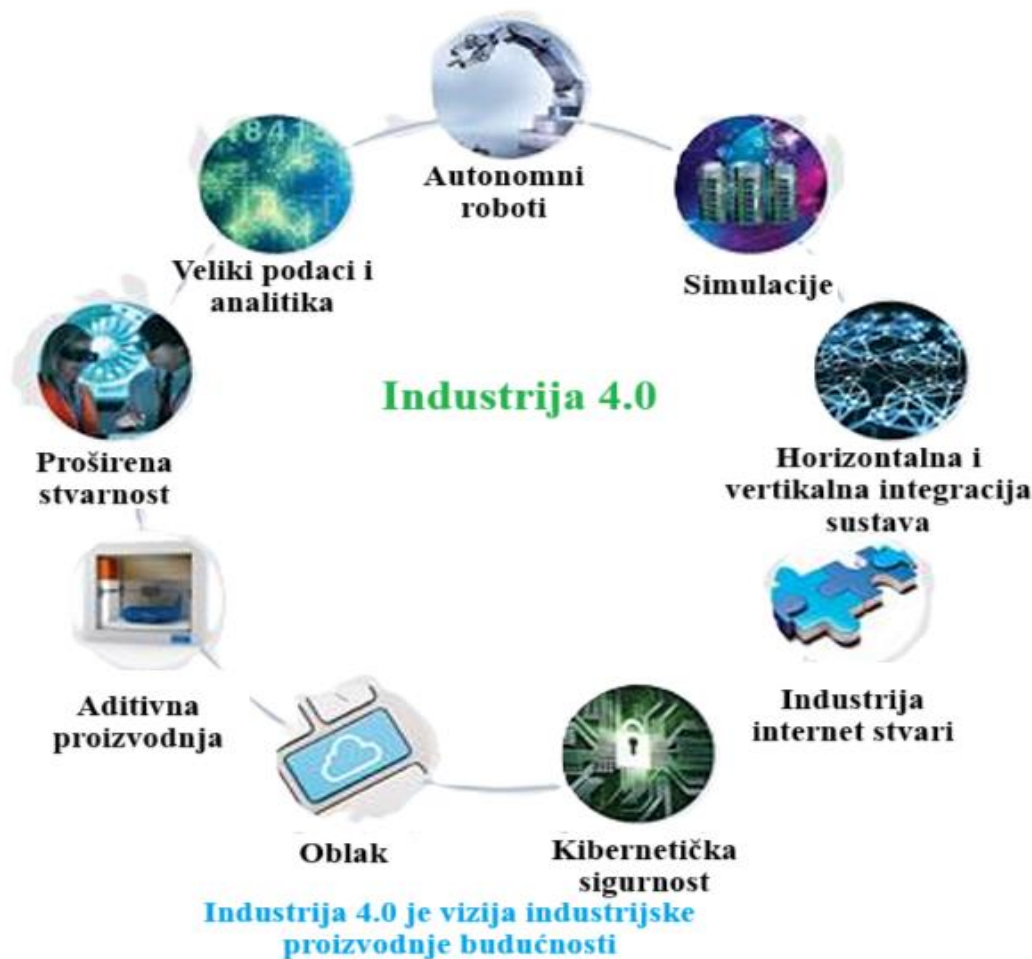
Slika 2. Devet stupova industrije 4.0 [1].

kibernetičko-fizički sustavi, mogu međusobno komunicirati koristeći standardne internetske protokole, analizirati podatke kako bi predvidjeli kvarove, sami se konfigurirati i prilagođavati promjenama.