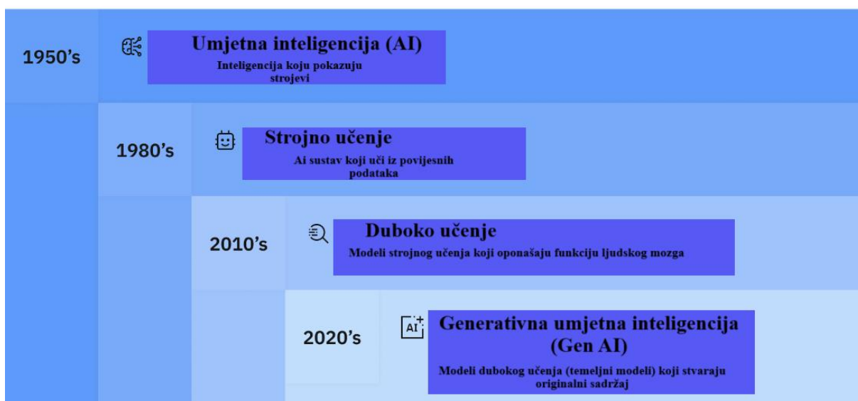
Slika 3. Povijesni razvoj umjetne inteligencije [5].

AI sustavi postali su ključni alati u modernom poslovanju i industriji zbog svoje sposobnosti da analiziraju ogromne količine podataka, otkriju uzorke, i donesu predviđanja koja mogu pomoći u optimizaciji procesa i donošenju odluka. Kada govorimo o umjetnoj inteligenciji, važno je razumjeti da ona predstavlja rezultat više od 70 godina kontinuiranog razvoja i niza evoluiranih koncepata, koji je danas čine izuzetno moćnim alatom [5].