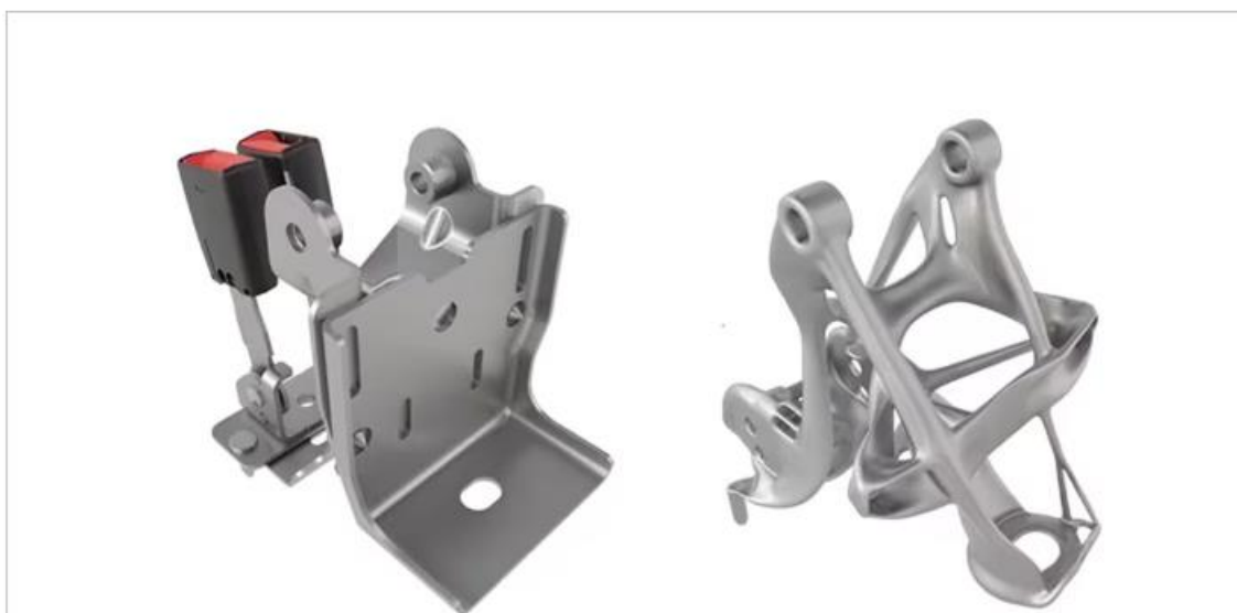
Slika 8. Stari dio kućišta sačinjen od osam manjih dijelova (lijevo) i novi jedinstveni komad dobiven generativnim dizajnom (desno).

General Motors je u suradnji s Autodesk-om koristio generativni dizajn kako bi optimizirao dizajn držača sjedala. Stari drzac je bio kockastog oblika nacinjen od ukupno 8 manjih dijelova. U ovoj aplikaciji, AI je generirao više od 150 različitih verzija ovog dijela, uzimajući u obzir faktore poput čvrstoće, težine i troškova proizvodnje. Konačni dizajn rezultirao je jednim novim dijelom koji je bio 40% lakši i 20% jači od prethodnog, smanjujući time troškove materijala i poboljšavajući performanse proizvoda [9].