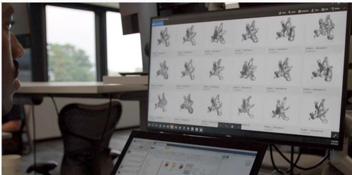
Slika 5. Inženjer pregledava varijacije generativnog dizajna jednog proizvoda [9].

Optimizacija dizajna je jedan od najvažnijih aspekata proizvodnog procesa gdje generativna umjetna inteligencija (AI) pokazuje svoj puni potencijal. Generativni AI modeli omogućuju inženjerima i dizajnerima da istraže tisuće ili čak milijune dizajnerskih varijacija u vrlo kratkom vremenu, uzimajući u obzir različite parametre kao što su materijali, troškovi, proizvodni procesi, i performanse. Kada govorimo o optimizaciji dizajna primjenom generativnog AI-a tad govorimo o generativnom dizajnu [9]. Generativni dizajn je način na koji istražujemo različita dizajnerska rješenja pomoću oblaka podatak i umjetne inteligencije kombinirajući inženjera i kompjuter [9].