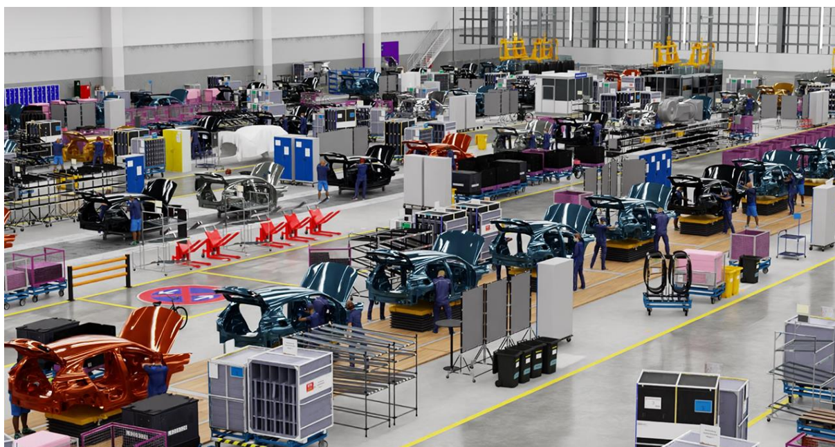
Slika 7. Prikaz digitalnog blizanca tvornice BMW-a. [10].

BMW koristi NVIDIA Omniverse [10] platformu za stvaranje digitalnih kopija svojih proizvodnih pogona, čime se omogućuje virtualno testiranje i optimizacija proizvodnih linija prije nego što se stvarne promjene implementiraju. Ova tehnologija omogućuje BMW-u da u stvarnom vremenu simulira različite proizvodne scenarije, identificira potencijalne uska grla i optimizira tokove materijala. Korištenje generativne AI na ovaj način omogućava kompaniji da brzo prilagodi proizvodne linije novim modelima vozila, smanjujući vrijeme prilagodbe i povećavajući fleksibilnost proizvodnog procesa za 30%[10]. BMW je poznat po svojoj prilagodljivosti u proizvodnji, jer dnevno proizvede desetak automobila s gotovo 40 mogućih modela, koji se mogu prilagoditi na više od 100 različitih načina.