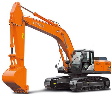
Slika 7.2 Rovokopač proizvođača Hitachi.

Glavna upotreba je iskopavanje i premještanje zemlje. Razlikuju se po veličini i snazi motora s unutarnjim izgaranjem koji se ugrađuje u njih. Postoji više kategorija rovokopača.