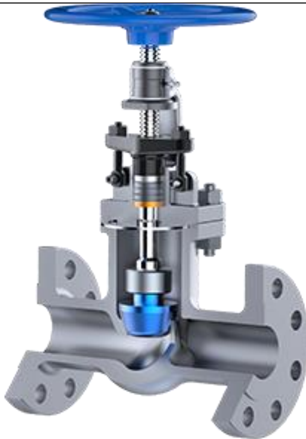
Slika 2. Standardni regulacijski ventil s linearnim gibanjem [4]