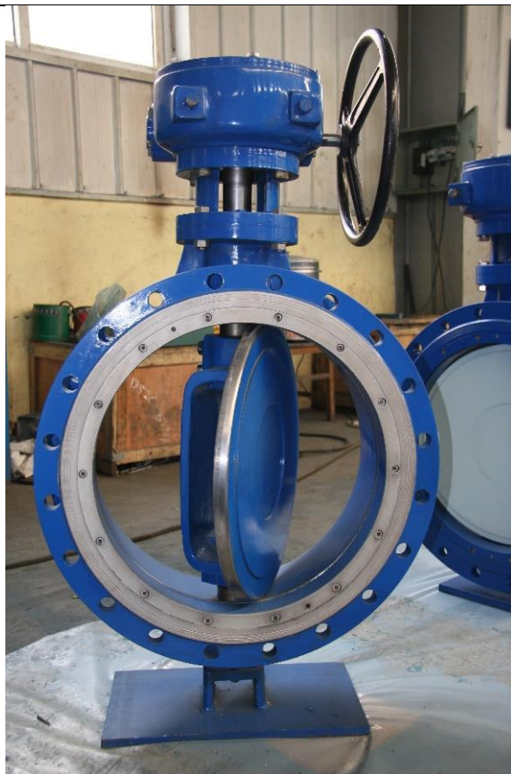
Slika 3. Leptirasti ventil [5]