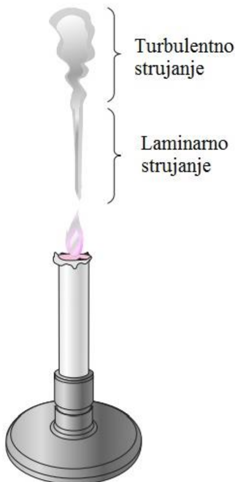
Slika 6. Shematski prikaz strujanja [8]

Potrebno je spomenuti još prigušeno i neprigušeno strujanje. Prigušeno strujanje je zapravo efekt stlačivih fluida, a vrijednost koja je „ugušena“ jest brzina fluida. Ovo svojstvo događa se prilikom dinamičkih uvjeta povezanih s Venturijevim efektom. Ukoliko prilikom strujanja fluida s određenim tlakom i temperaturom on prođe kroz nekakvo suženje (ekspanzijska ili redukcijaska cijev/ulaz iz cijevi u ventil) ulazi u područje nižeg tlaka, stoga dolazi do povećanja brzine strujanja fluida. Venturijev efekt uzrokuje statički tlak, imajući za posljedicu smanjenje gustoće nizvodno. Prigušeno strujanje jest ograničeno stanje pri kojem se uslijed daljnjeg prigušenja tlaka neće povećavati protok. Treba voditi računa o tome da je brzina strujanja ograničena, što znači da se maseni protok povećava podizanjem uzvodnog tlaka tj. povećanjem gustoće fluida. Pod uvjetima prigušenog strujanja, ventili i prigušnice se mogu koristiti za dobivanje željenog protoka.