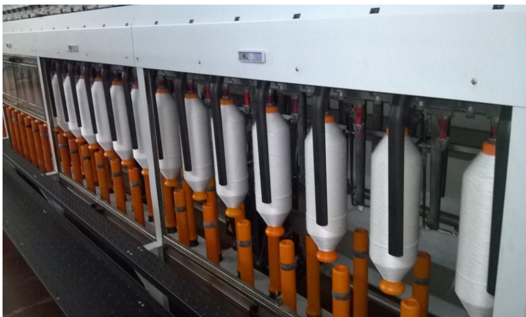
Slika 9. Pretpredenje na flajeru

Za neposredno pređenje uobičajenih finoća pređa od pramena istežalice trebalo bi na prstenastoj predilici primijeniti vrlo visoke istege 200 do 300 puta. Kako dugi niz godina nisu postojali istežni uređaji koji bi dali zadovoljavajuću kvalitetu (jednolikost) pređe uz primjenu visokih istega, postupak profinjenja pramena istežalice provodio se postepeno u pretpredionici na nekoliko pasaža flajera. [1] Za grublje finoće pređa koristile su se dvije pasaže, za srednje tri, a kod najfinijih pređa četiri ili čak pet pasaža flajera. Pronalaskom visokoistežnih uređaja na flajerima (Slika 9.) i prstenastim predilicama broj pasaža se smanjio na jednu (visokoistežni flajer) samo izuzetno dvije pasaže.