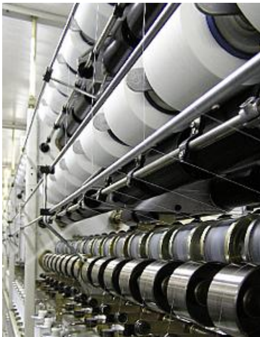
Slika 3. Prikaz stroja za pređenje pamuka

Potrebna čvrstoća pređe od vlakna obično se postiže uvijanjem. Kada se govori o vlasku govori se o vlaknima rezanim na odgovarajuću duljinu. Pod pređenjem u širem smislu razumijeva se i izradba i primarna priredba vrlo dugih, tzv. beskrajnih niti (filamenata) kojima se dobiva proizvod (monofilamentna ili multifilamentna pređa). Duljina pređe ograničena je dimenzijama namotka. Namotak je tulac određene duljine, u tekstilnoj industriji je ograničen na duljinu 30 centimetara. [1]