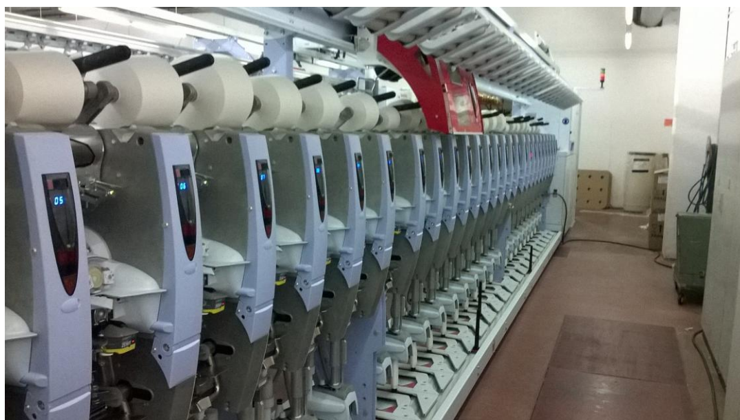
Slika 13. Autokoner

Nakon završenog postupka obrade pamuka pređa se mora pakirati. Prije pakiranja i zamatanja se mora ovlažiti na određeni postotak vlage koji tržište nalaže. Uređaj kojim se ovlažuje naziva se ovlaživač pređe (Slika 14.).