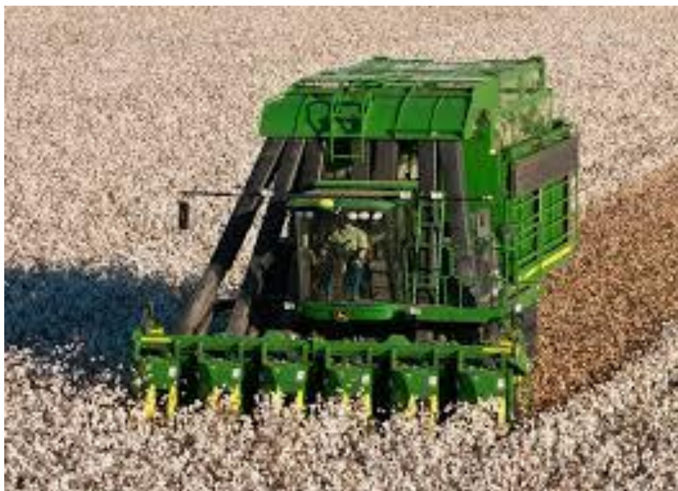
Slika 2. Berba na plantaži pamuka

Pamuk se prvi put počeo uzgajati već 5000 godina prije nove ere u Južnoj Americi (Peru) i Aziji (Indija). Uzgajane su različite vrste vrste pamuka, koje lako uspijevaju u tropskim i suptropskim podnebljima. Iz Indije, koja je 2000 godina držala monopol u proizvodnji i korištenju pamuka, ta se strateška sirovina u vrijeme Aleksandra Velikog raširila u zemlje Perzijskog zaljeva, arapske zemlje, malu Aziju i u Kinu. Kultura pamučike se u levantskim zemljama (Egipat, Grčka, Sirija, Turska) pojavila 100. do 300. godine. Potom su arapski trgovci od 6. do 10. stoljeća donijeli pamuk u istočno Sredozemlje, sjevernu Afriku, Siciliju i Španjolsku. Sama trgovina pamukom se raširila na cijeli Apeninski poluotok, a centri te trgovine su bili u Veneciji, Milanu, Genovi i Firenci. Europski doseljenici su u 17. stoljeću sobom donijeli pamuk i u Sjevernu Ameriku. [4]