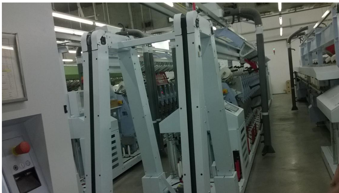
Slika 12. Automatsko povezivanje prstenaste predilice sa autokonerom