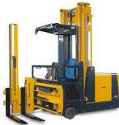
Slika 17. Prikaz predloženog viličara sa zakretnim vilicama

Kada je u pitanju transport na mjesta prodaje, treba uzeti u obzir obnovljenu željezničku mrežu koja prolazi kraj Predionice. Koristila se do 90-ih godina prošlog stoljeća kao jedina poveznica sa tržištem. Prijevoz kamionima stvara značajniji trošak uspoređujući sa prijevozom vlakom. S obzirom na količinu robe koja se prevozi to bi bio veliki plus ukoliko bi se ponovno ostvarilo.