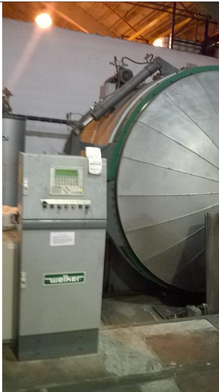
Slika 14. Ovlaživač pređe