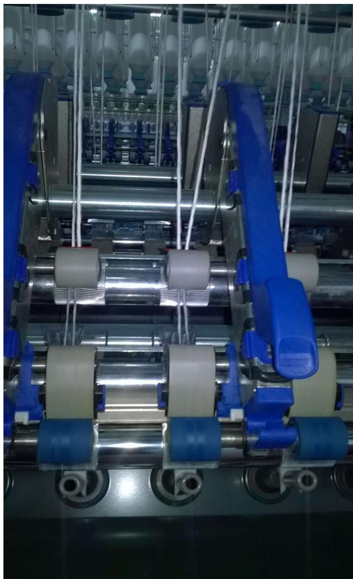
Slika 11. Povezivanje dvije niti u jednu na prstenastoj predilici

Prstenasta predilica je automatski preko mosta spojena sa autokonerom (Slika 12.). Uloga autokonera je ponovno prematanje pređe te završno uklanjanje nečistoća. Postupak je automatski, a prelja (radnica) spaja nit ukoliko dođe do zastoja, te slaže namotaje pređe na palete.