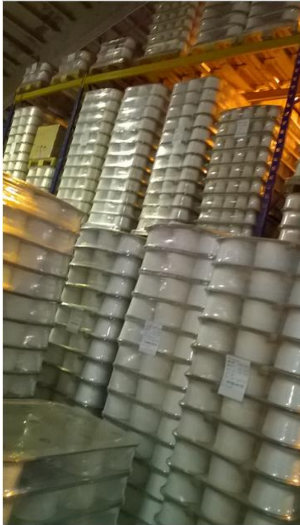
Slika 15. Skladište

Transport se izvodi regalnim viličarem (Slika 16.) za koji je potrebna širina prolaza 2,4 metra. Uvođenjem viličara sa zakretnim vilicama (Slika 17.) kod kojeg je potrebna širina prolaza 1,8 metara dobili bismo na skladišnom prostoru.