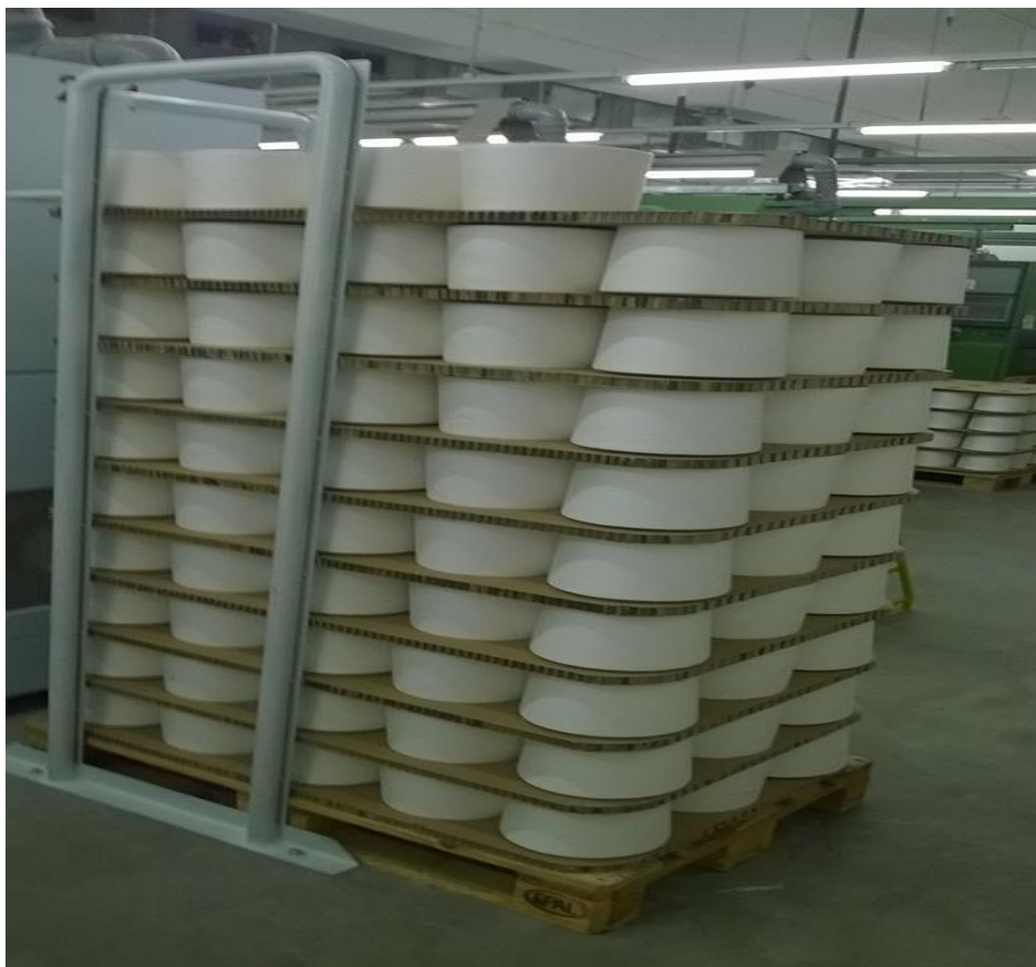
Slika 4. Gotov proizvod tehnologije pređenja, pređa

Tako se od pamučnih vlakana izrađuje pređa (Slika 4.) za proizvodnju različitih vrsta rublja (odjevnog, postelnog, stolnog), jer ona dobro upija vlagu te se lako peru i održavaju. Od vunениh vlakana izrađuje se pređa za proizvodnju dijelova gornje odjeće, jer su ona dobar toplinski izolator. Za dobivanje pređe upotrebljive u proizvodnji gotovo svih vrsta tekstila upotrebljavaju se kemijska vlakna. Zbog velike čvrstoće osobito su prikladna za dobivanje tehničkih tekstila. Od mješavine prirodnih i kemijskih vlakana mogu se izraditi različite vrste pređe s povoljnijim karakteristikama od pređe koja je izrađena samo od prirodnih ili kemijskih vlakana.