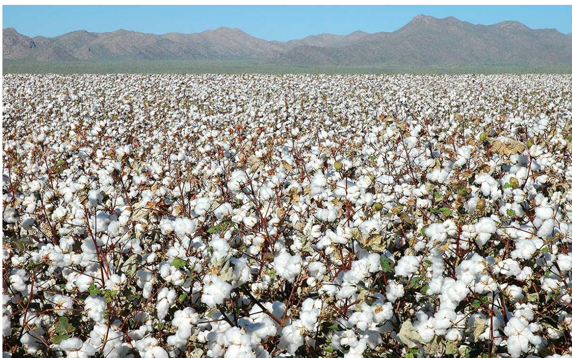
Slika 1. Polje pamuka

Pamuk (Slika 1.) je možda i najvažnije vlakno za izradbu tkanina. To je mekano vlakno koje raste oko sjemena biljke Gossypium . Raste u tropskim i suptropskim područjima. Svaka biljka stvara komuške (sjemene čahure) koje sadrže oko 30 sjemenki. Zrele sjemene čahure rasprsnu se i otvore te se pokažu pahuljasta vlakna. Pahuljasta masa koja se odvoji od sjemenki, poznata je kao pamučna pahuljica i koristi se za izradu tkanina. Sjemenke pamuka se ne bacaju. Iz njih se ekstrahira mast za dobivanje jestivog ulja, a sjemenke se potom prerađuju u stočnu hranu i gnojivo. [3]