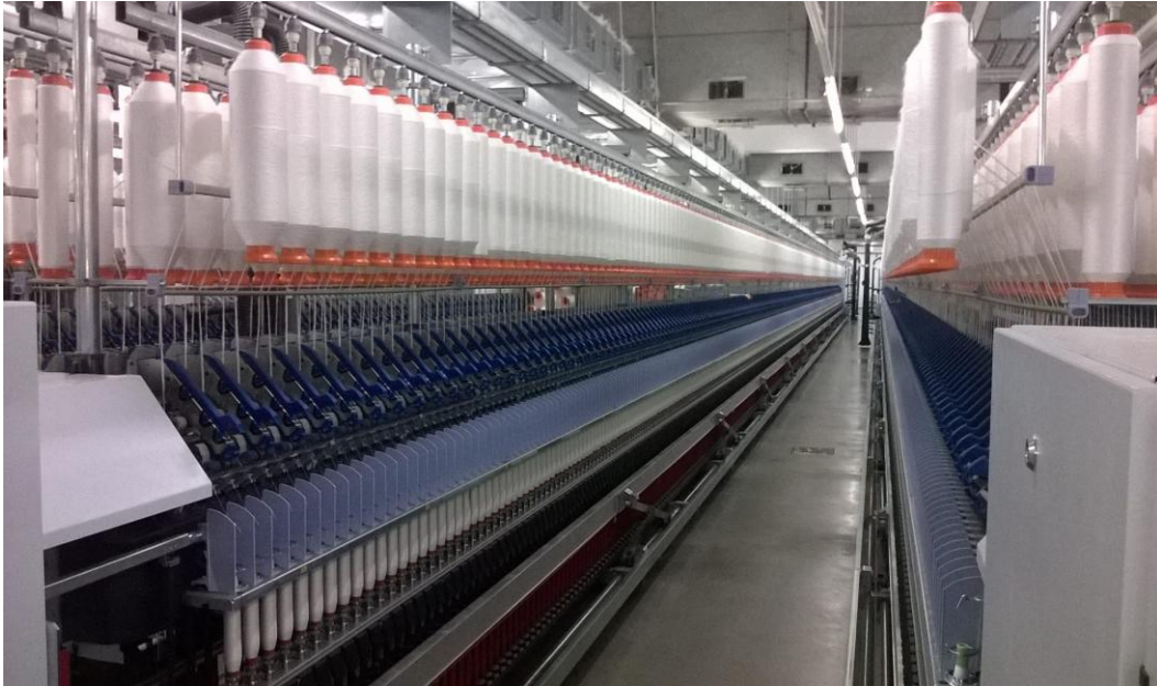
Slika 10. Prstenaste predilice

Spomenuti postupci znatno se razlikuju u osnovnim tehnološkim radnjama, tj. načinu istežanja i uvijanja pa se struktura i kvalitativne karakteristike proizvedenih pređa znatno razlikuju.