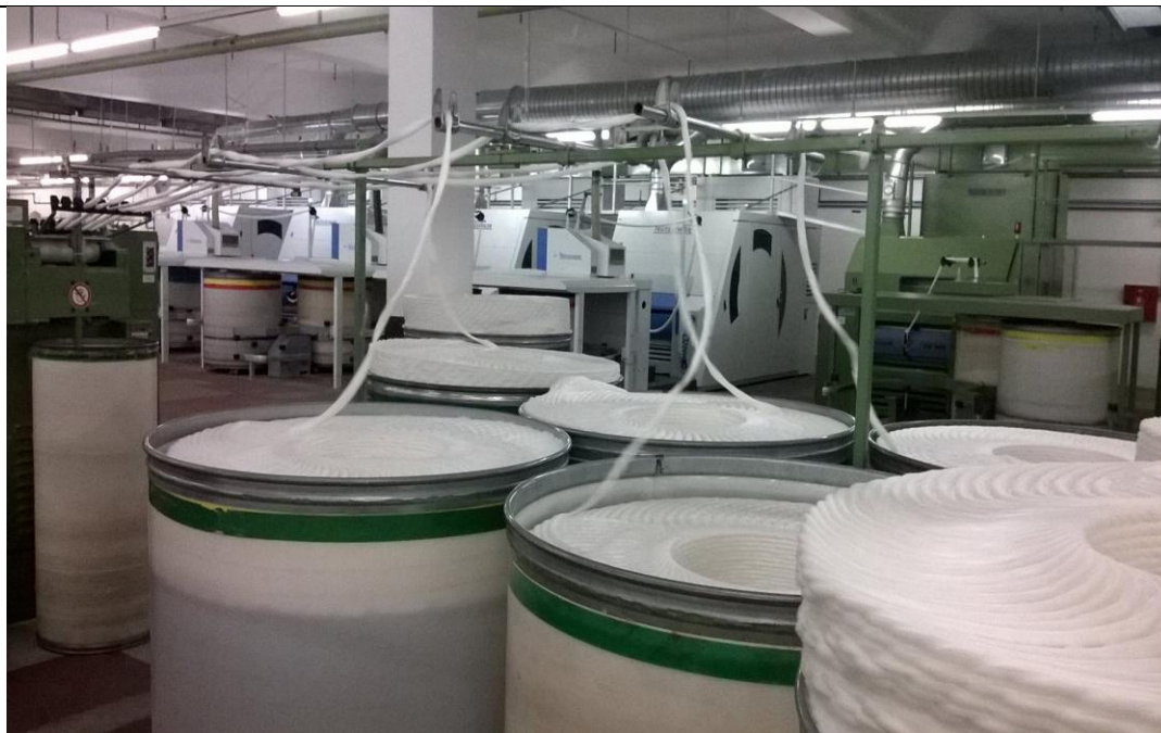
Slika 8. Istezalica

Međutim, istežanje je i jedna od temeljnih funkcija pređenja. Tako je, npr. grebenanje popraćeno velikim istežanjem (stostrukim s obzirom na ulazno runo i izlazni pramen). Istežanje je također jedna od važnih funkcija pretpredilica i predilica.