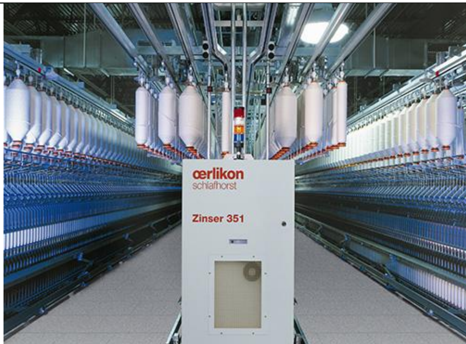
Slika 18. Prstenasta predilica Zinser 351

Vrijednost strojeva prema ponudi dobavljača je oko 3,323 milijuna kuna za stroj, što bi za dvije predilice iznosilo oko 6,646 milijuna kuna, a zavisni troškovi prilagodbe sustava podzemnih odsisnih kanala i te prilagodba rasvjete iznosili bi prema ponudama dobavljača oko 600 tisuća kuna. Točni iznosi odredili bi se prema stvarno izvršenim radovima i utrošenom materijalu no sveukupno ulaganje po mojoj procjeni nebi iznosilo više od 7,3 milijuna kuna.