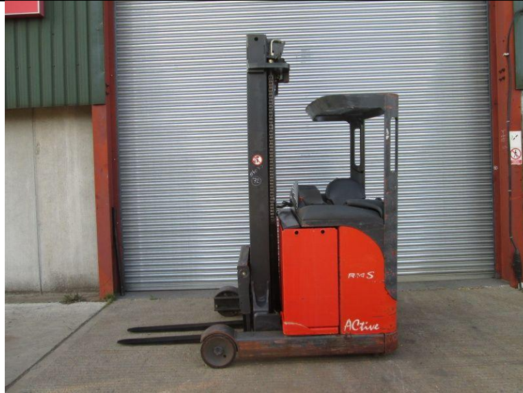
Slika 16. Prikaz regalnog viličara