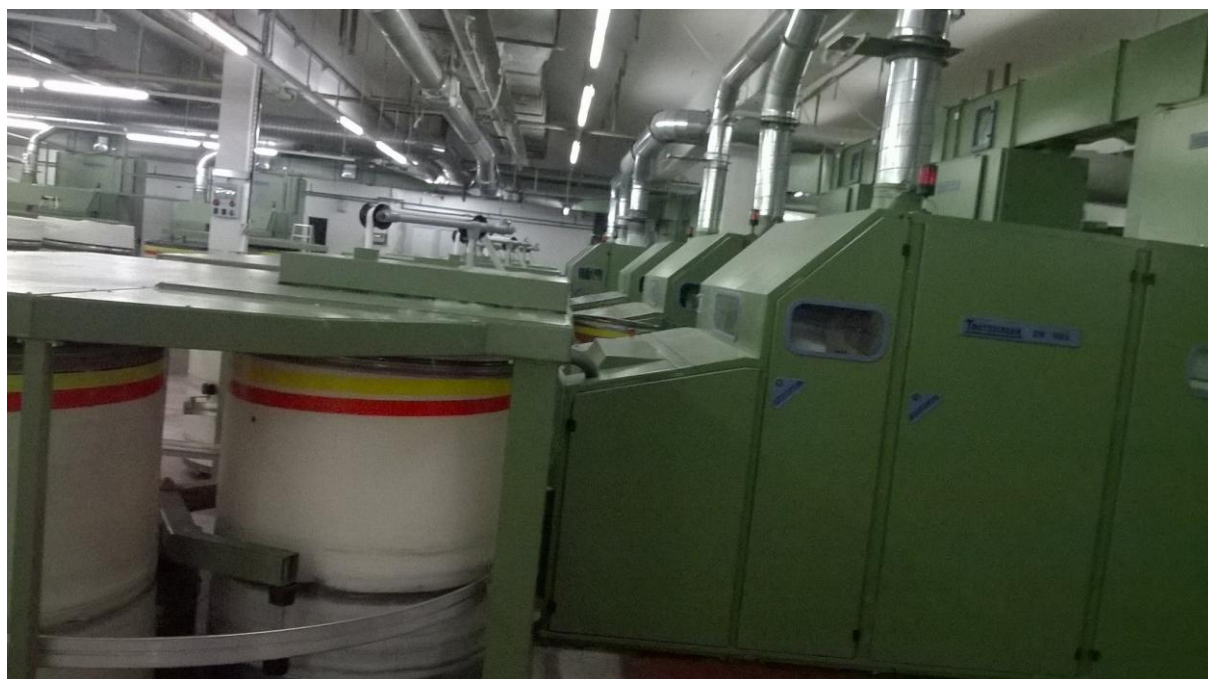
Slika 7. Grebenaljka