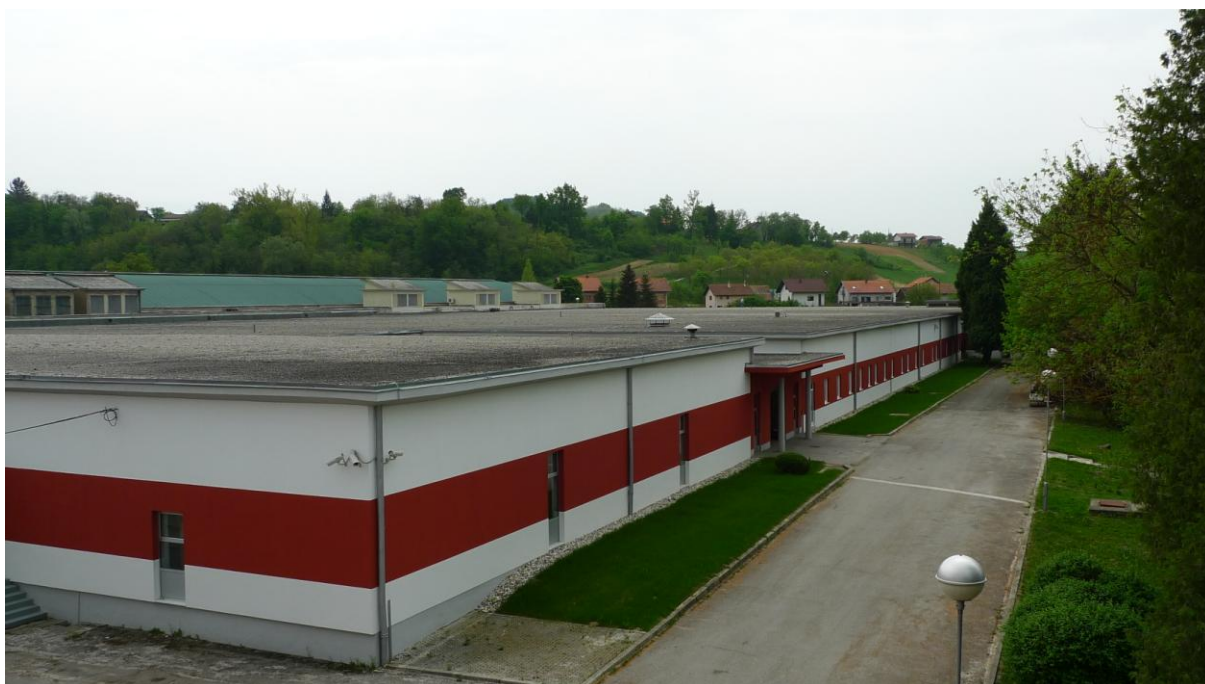
Slika 5. Predionica Klanjec

Predionica Klanjec (Slika 5.) danas ima proizvodni kapacitet od 25 tona, u što je uključeno više od 14 000 vretena na prstenastom pređenju, 2 380 rotorskih jedinica, te 120 zračnih jedinica. [5]