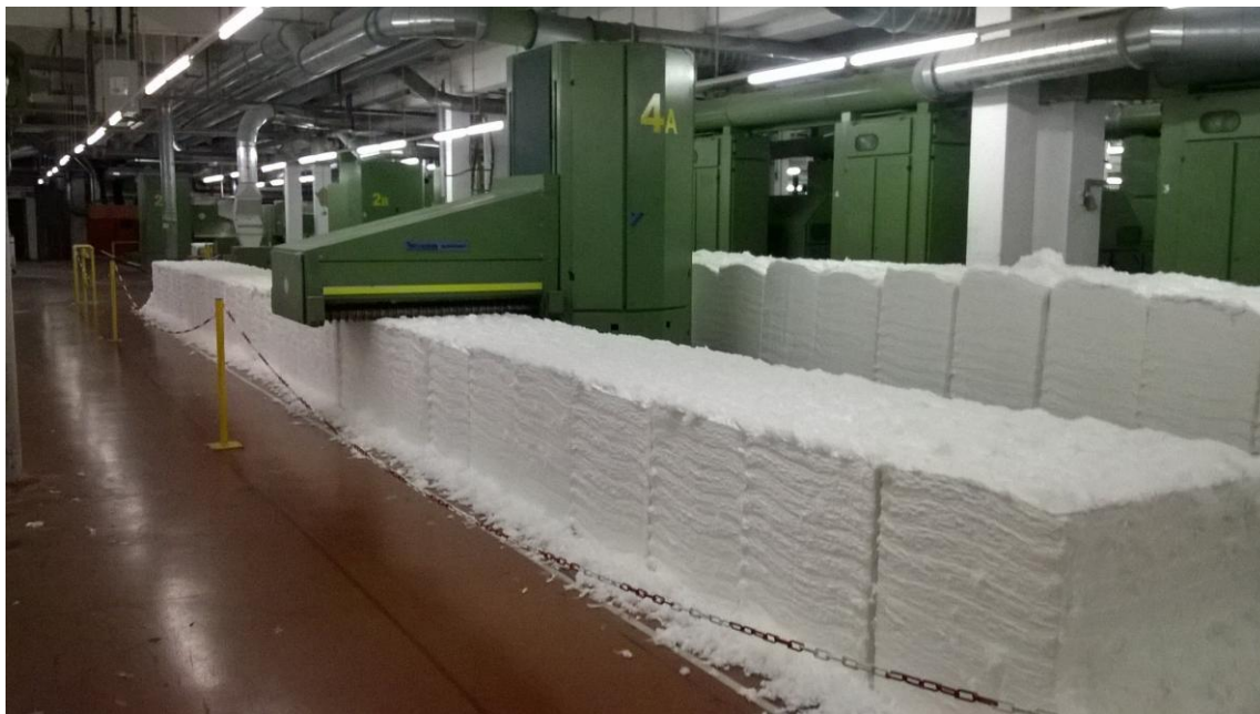
Slika 6. Putujući otvarač bala

Osnovni tehnološki zadatak i rad stroja za čupanje je u suštini vrlo jednostavan. Valjak za čupanje smješten u uređaju za čupanje, čupa čuperke materijala iz bala pored kojih prolazi. Ventilator smješten u okretnom tornju odsisava čuperke i transportira ih kroz vertikalni (pomični) kanal u kanal i dalje zračnom strujom kroz koljenasti cjevovod s trajnim magnetima pomoću posebnog ventilatora do idućeg stroja u pripremi pamuka.