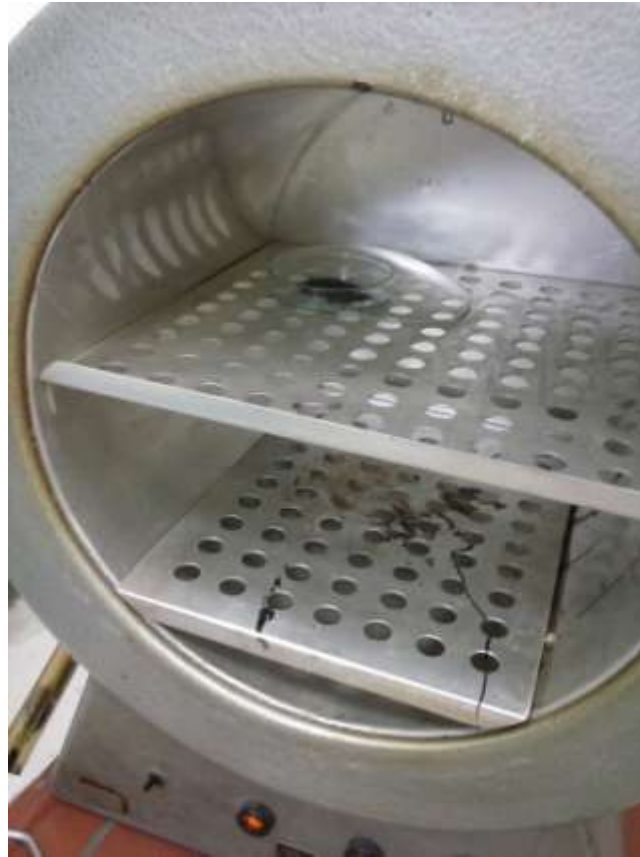
Slika 3.1. Sušionik u laboratoriju

Ugljen u ovom ispitivanju se prvo morao osušiti. Osušen je u sušioniku na temperaturi od 105 °C. Korišteni sušionik se nalazi na slici: