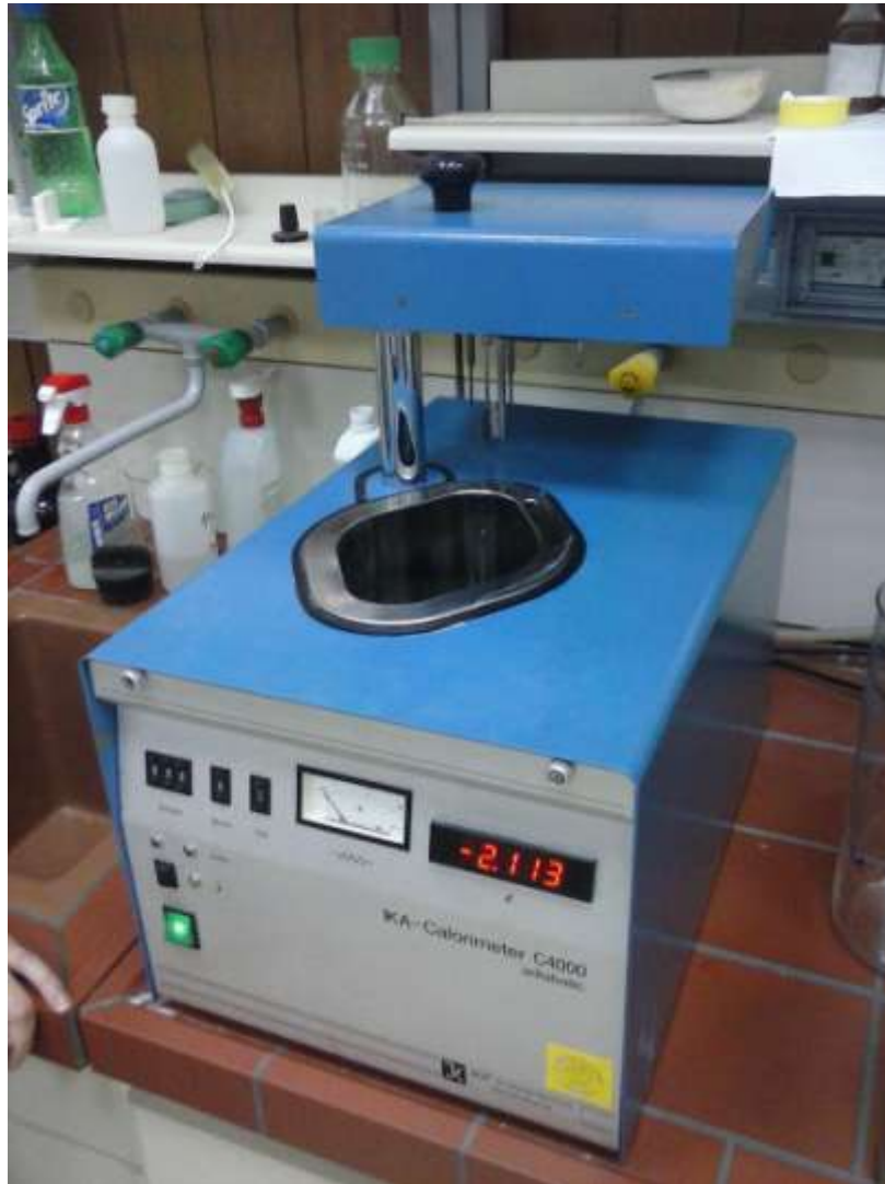
Slika 2.3. Adijabatski kalorimetar C 4000 A

Za ispitivanje se koristio kalorimetar oznake C 4000A koji se nalazi u Laboratoriju za vodu, gorivo i mazivo Fakulteta strojarstva i brodogradnje..