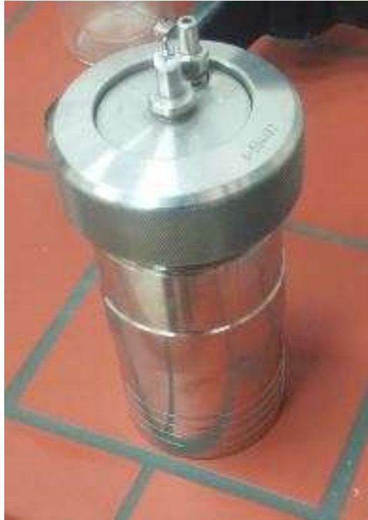
Slika 2.2. Bomba kalorimetra