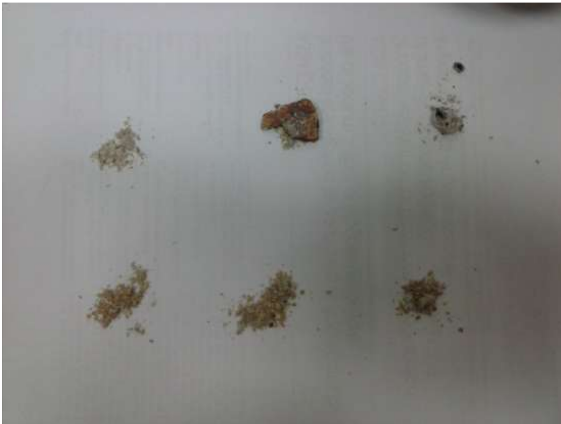
Slika 3.5. Uzorci pepela nakon izgaranja. 3 u dostavnom i 3 u sušenom stanju

Pepeo ugljena se ispitivao u peći na 750° C. Vrijeme trajanja ispitivanja u peći je bilo 2 do 3 sata. Prije samog izgaranja u peći, uzorak se izvagao i stavio u posebne keramičke posudice otporne na visoke temperature i vatru. Nakon što je uzorak izgorio, ostatak se izvagao. Sav taj ostatak se smatrao pepelom, koji je najčešće sive, bijele i crne boje. Na slici se može vidjeti šest uzorka pepela nakon izgaranja u peći: