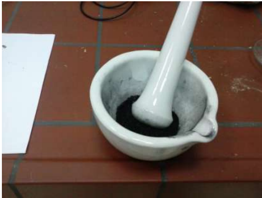
Slika 3.2. Tarionik sa usitnjenim ugljenom

Za razliku od ugljena u dostavnom stanju, ugljen u sušenom stanju je bio stavljen u želatinoznu kapsulu. Zbog toga se u jednadžbi za računanje ogrjevne vrijednosti mora uzeti u obzir i ogrjevna vrijednost kapsule: