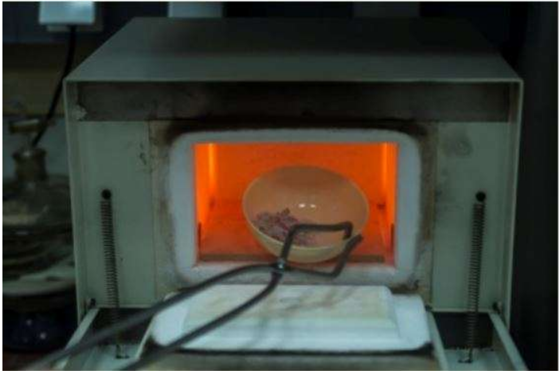
Slika 2.5. Korištena laboratorijska peć