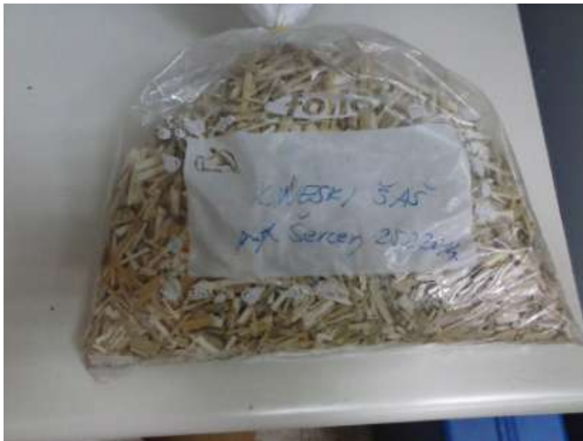
Slika 3.3. Kineski šaš

Drugo gorivo koje se ispitalo su bili peleti od kineskog šaša. Peleti se dobivaju od različitih biljnih vrsta, drvenaste građe. Nakon što se osušena biljka usitni, potrebno je zagrijavati usitnjeni materijal, da bih došlo do izlučivanja prirodnog vezivnog sredstva iz same biljke. Različite biljke imaju različite temperature pri kojima puštaju ta vezivna sredstva. Pri zagrijavanju se ujedno i materijal provodi kroz ekstruder, koji provlači materijal kroz uski, kružni, poprečni presjek iz kojeg izlazi oblikovan pelet. Peleti su najčešće promjera 5-10 mm i dužine 10-40mm. Odlično su ogrjevno sredstvo, zbog svoje čvrstoće i jednostavnog doziranja u ložište. Udio vlage je vrlo nizak, te se kreće do maksimalno 10%. Zbog dobrih svojstava kao gorivo, kompaktnost i prirodni materijal, sve više se koristi.