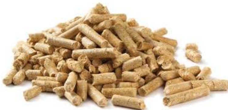
Slika 3.4. Peleti

Ogrjevna vrijednost peleta u dostavnom stanju računala se iz iste jednadžbe kao i za računanje ogrjevne vrijednosti ugljena u dostavnom stanju.